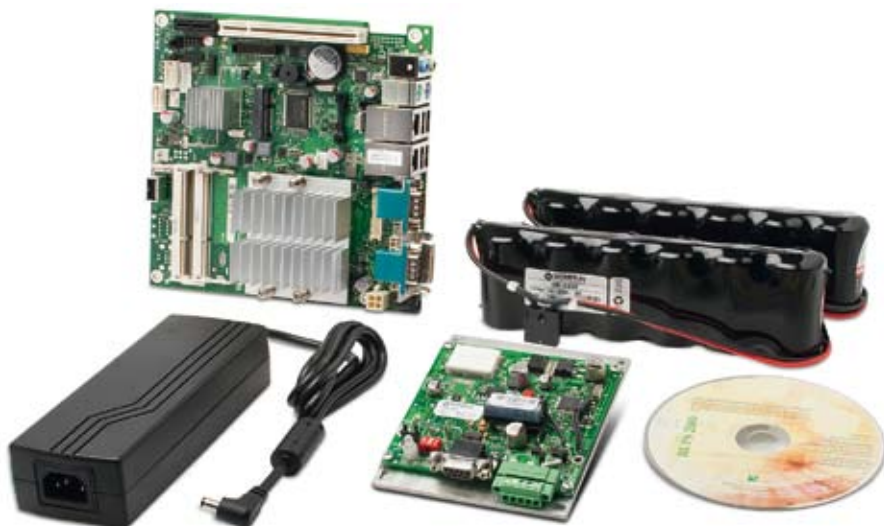
Bild 2: Applikationsbeispiel für ein PC-Komplettsystem auf Basis eines Tischnetzteils, kombiniert mit einer DC-USV

der Leistungselektronik aufgreifen und geschickt kombinieren, um Störungen im Netzteil gar nicht erst entstehen zu lassen. Hochwertige Medizinnetzteile erfüllen in diesem Zusammenhang die Norm EN 55011 in der anspruchsvolleren Klasse B.