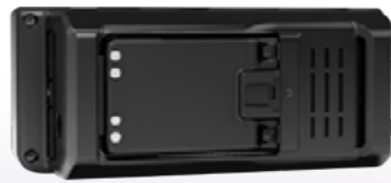
Angebauter BP-272 (Ansicht der Rückseite)

Die Stromversorgung erfolgt über einen Li-Ionen-Hochleistungs-Akkupack, der auch in den Handfunkgeräten ID-51E und ID-31E zum Einsatz kommt. Für den Betrieb und zum Laden des BP-272 kann eine externe 13,8-V-Gleichstromversorgung angeschlossen werden.