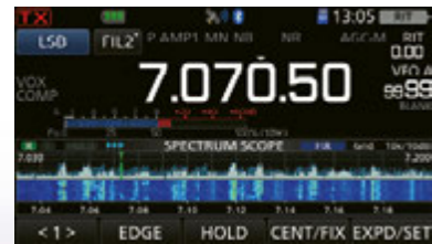
Anzeigebeispiel des Echtzeitspektrumkops und der Wasserfallanzeige

Wie beim IC-7300 und IC-9700 erfolgt die Bedienung des Spektrumkops durch Berührung. Die Bedingungen auf dem Band werden in Echtzeit angezeigt, so lässt sich leicht eine freie Frequenz finden. Und das alles in einem kompakten Funkgerät ohne teures Zubehör.