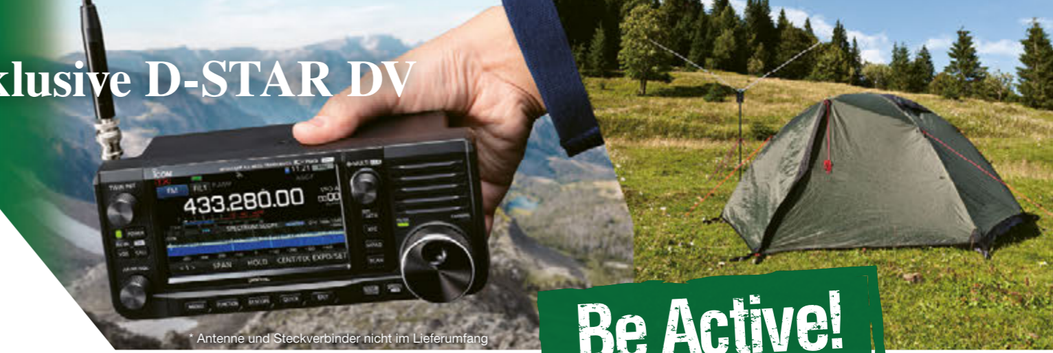
* Antenne und Steckverbinder nicht im Lieferumfang

Die Stromversorgung erfolgt über einen Li-Ionen-Hochleistungs-Akkupack, der auch in den Handfunkgeräten ID-51E und ID-31E zum Einsatz kommt. Für den Betrieb und zum Laden des BP-272 kann eine externe 13,8-V-Gleichstromversorgung angeschlossen werden.