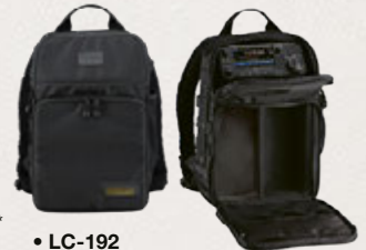
• LC-192 Multifunktions-Rucksack

Weitere Details zum LC-192 finden Sie auf unserer Website.