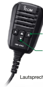
programmierbare Tasten Up-/Down-Tasten Lautsprechermikrofon HM-243

Das mitgelieferte programmierbare Lautsprechermikrofon HM-243 ist perfekt für den Portabelbetrieb mit dem IC-705 im optionalen Rucksack LC-192 geeignet. Mit den programmierbaren Tasten lassen sich z. B. Frequenz- und Lautstärkeinstellungen vornehmen, ohne den Rucksack abzulegen.