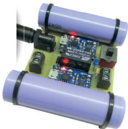
Bild 2. Der Prototyp während des Ladevorgangs. Normalerweise haben die Lademodule eine rote LED, die während des Ladevorgangs leuchtet, und eine blaue LED, die anzeigt, dass der Ladevorgang abgeschlossen ist.

Das ordnungsgemäße Laden von zwei oder mehr 18650er-Zellen in Reihe erfordert spezielle Ausgleichs- und Schutzschaltungen, um zu verhindern, dass eine Zelle nur teilweise geladen und eine andere überladen wird. Nach einigem Experimentieren habe ich eine interessante Lösung gefunden, um dieses Problem zu umgehen. Sie verwendet zwei preiswerte und weit verbreitete Akkulademodule auf der Basis des TP4056. In diesem Projekt wurden solche Module mit eingebautem Überladungs- und Tiefentladungsschutz verwendet.